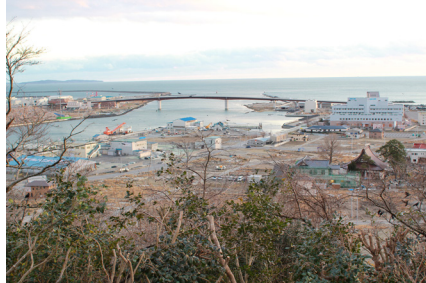
日和山からの眺望 (日和大橋)